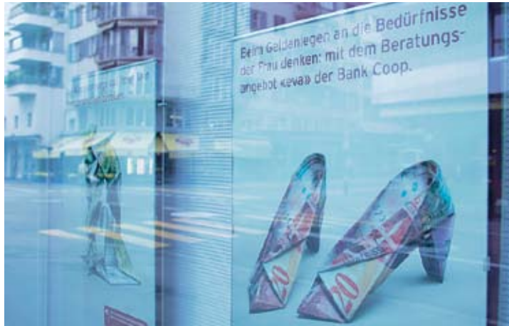
Nahezu alle Banken bieten Konsumkredite an.

Nebst den etablierten Anbietern GE Money Bank, Bank-now (Credit Suisse Group), Migros Bank, den Kantonalbanken der Westschweiz, der Berner Kantonalbank und den Captives sind damit ausser der UBS praktisch alle Banken direkt oder indirekt im Konsumkreditgeschäft vertreten. Dies zeigt, dass starker Wettbewerb unter den Anbietern besteht